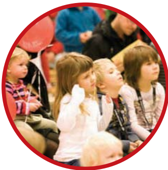
Barn och babymässa i Karlstad

-Jag önskar att mina teaterföreställningar om Lillebror och Lilla Anna ska öppna upp ytterligare ett sinne och gärna vara ett komplement eller en inkörsport till bokens värld. Böckerna om Lilla Anna och Lillebror finns att tillgå på alla bibliotek i landet och det är lätt för barnen att identifiera sig med rollfigurerna.